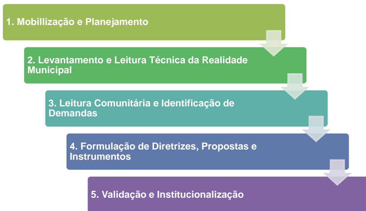
Figura 1 – Fases de Trabalho